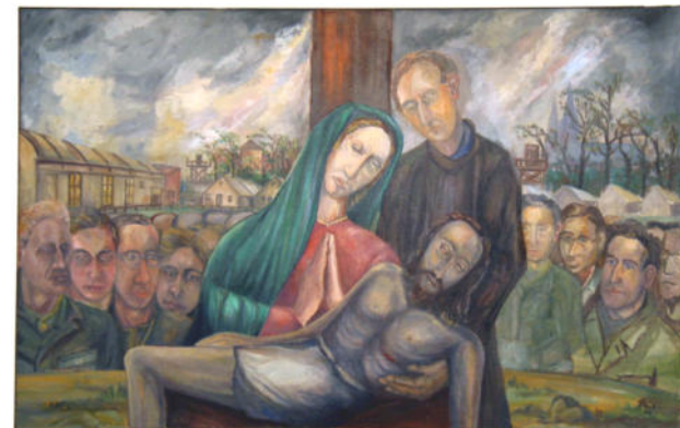
Franz Stockia esittävä maalaus, 1946.

15./16. kesäkuuta 1963 hänen jäännöksensä siirrettiin Chartresiin.